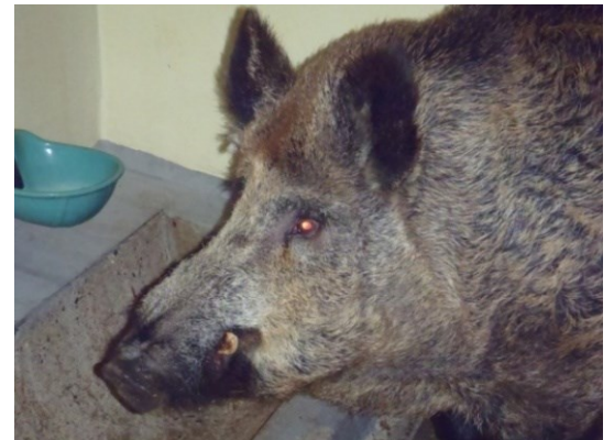
Le sanglier européen