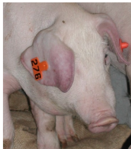
Rougeurs cutanées des extrémités