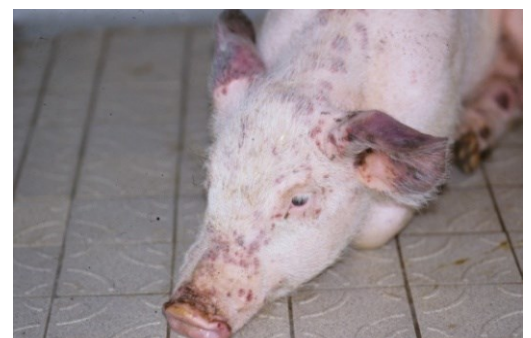
Le porc domestique