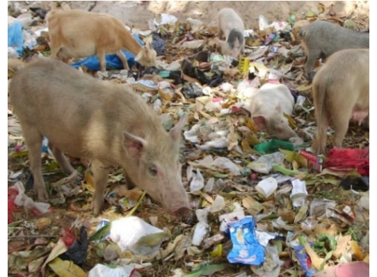
Accès à une décharge (eaux grasses)