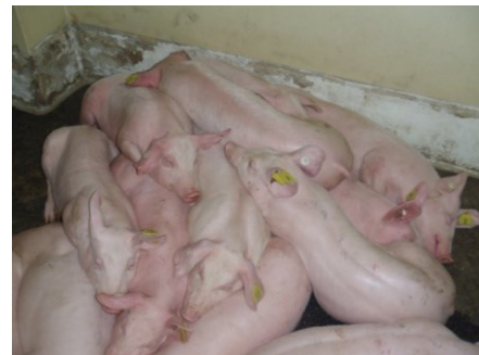
Mort subite avec peu de symptômes