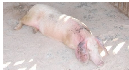
Perte d'appétit, apathie, cyanose, et problèmes locomoteurs dans les 24-48h précédant la mort