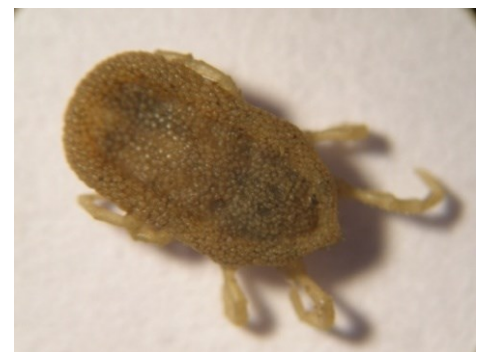
Tique molle du genre Ornithodoros spp