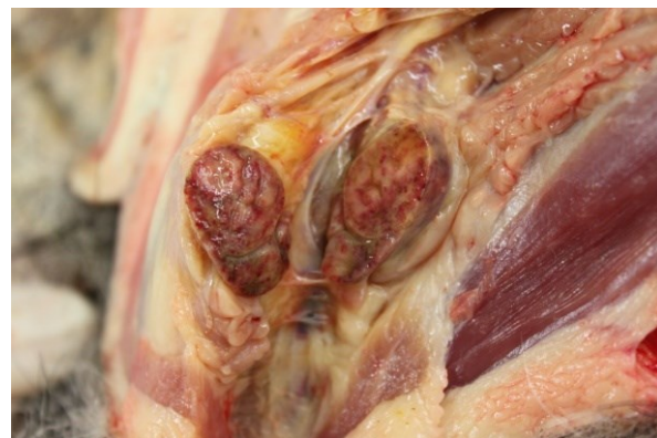
Lésions typiques sur rein et ganglions